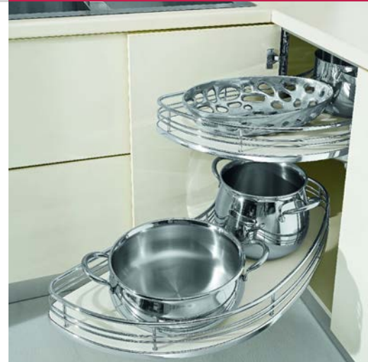
FLYMOON מתקן פינתי נשלף דו קומתי